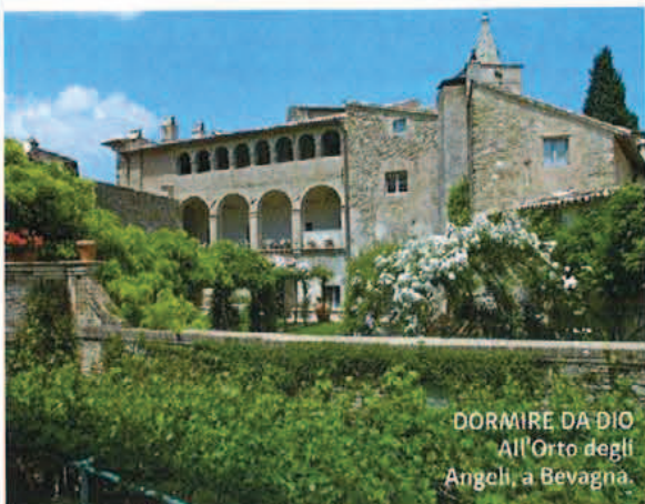
DORMIRE DA DIO All'Orto degli Angeli, a Bevagna.

HANNO COLLABORATO FEDERICO DE CESARE VIOLA E PAOLO SCARPELLINI