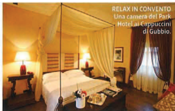
RELAX IN CONVENTO Una camera del Park Hotel ai Cappuccini di Gubbio.

GUBBIO (PG) Park Hotel ai Cappuccini Un monastero del XVII secolo nel verde con tele rinascimentali, arazzi fiamminghi e pezzi di design (via Tifernate, tel. 075 9234, parkhotelai cappuccini.it ; da 189 €).