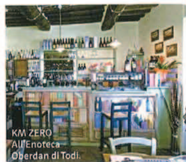
KM ZERO All'Enoteca Oberdan di Todì.

PERUGIA Il Gradale Stessa location da sogno del fratello maggiore Il Postale ma sala e proposta più informale e divertente. Tra